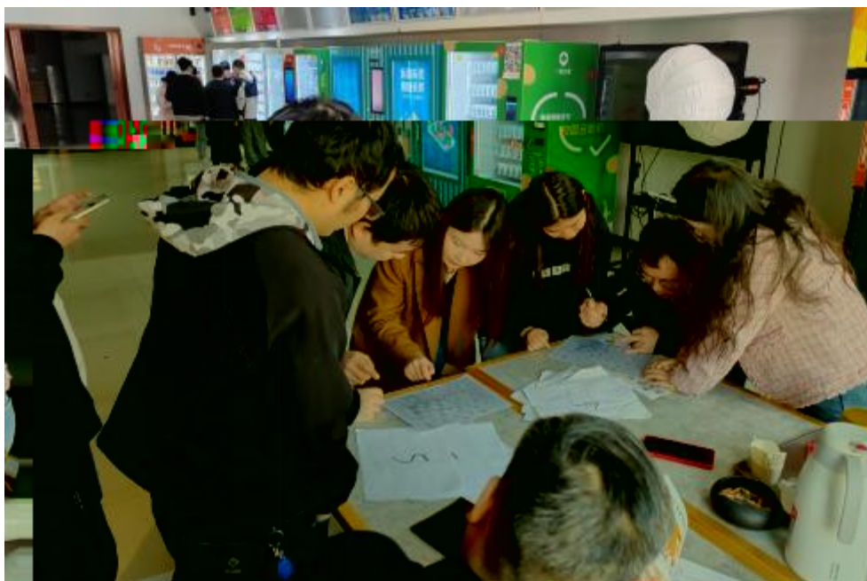
图 卓 团 建 共