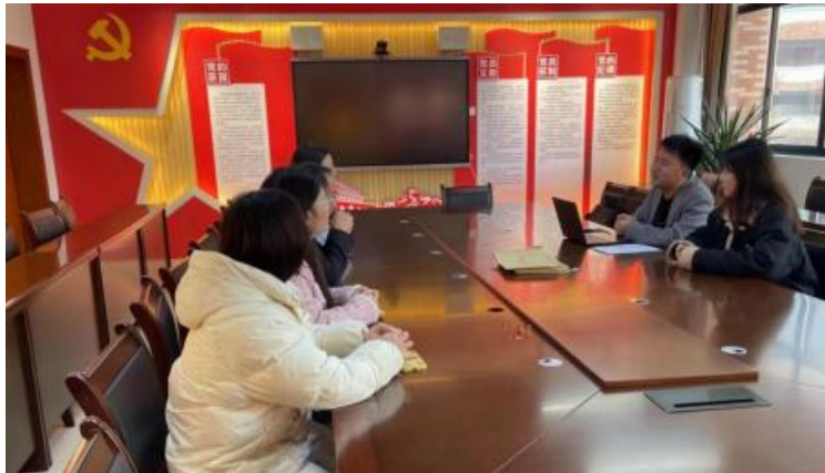
图 企开展学术 交 会