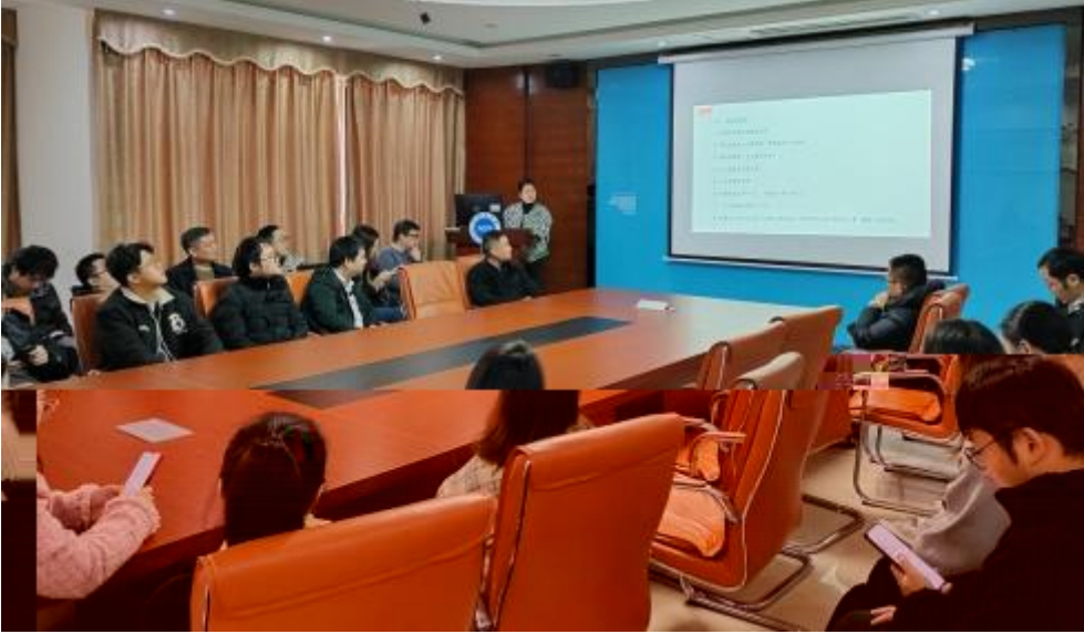
图 员工专业技 培